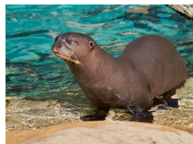
Loutre géante, Zoo de La Palmyre

6, Avenue de Royan – 17570 Les Mathes – www.zoo-palmyre.fr