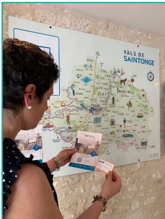
Carte Val'Idées. ©S. Vesque

Pour la troisième saison consécutive, la carte Val'Idées , destinée à tous (couple, famille, individuel) permet aux vacanciers, comme aux locaux, de bénéficier d'offres préférentielles en Vals de Saintonge. Valable jusqu'au 31 décembre 2023, elle est vendue au tarif de 5 € (pour toutes les personnes de plus de 15 ans) dans tous les Bureaux d'Information Touristique des Vals de Saintonge, à Saint-Jean-d'Angély, Matha, Saint-Savinien-sur-Charente et Aulnay-de-Saintonge. Sur présentation, les porteurs de la carte pourront bénéficier de réductions et de « bons plans » chez les partenaires Val'Idées.