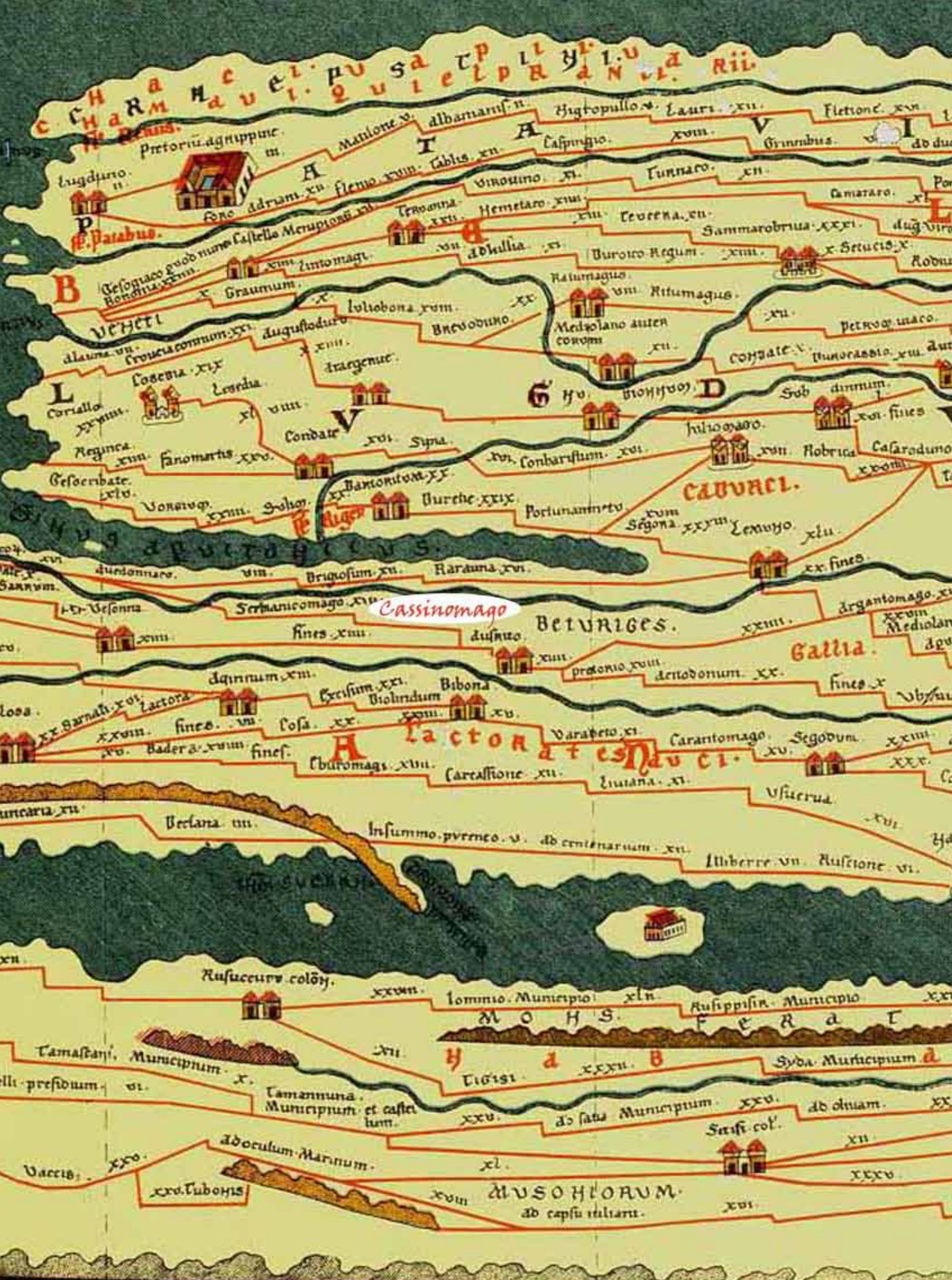
Table de Peutinger - Reproduction du XIII e siècle d'une carte routière du III e siècle