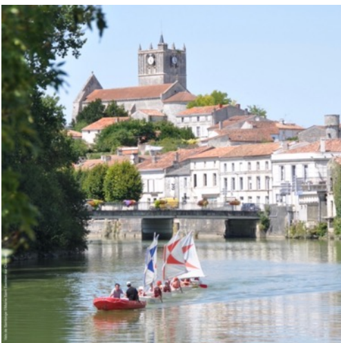
Grands rendez-vous 2023

Réalisée par l'association Parole & Patrimoine, l'exposition propose de découvrir un ensemble particulièrement riche et remarquable de costumes de femmes, d'hommes et d'enfants de la fin du XVIII e au début du XX e siècle. Jusqu'au 17 octobre 2023.