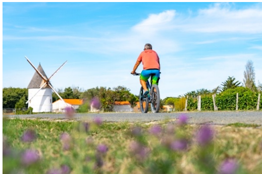
@arthurhabudzik-Moulin de La Brée