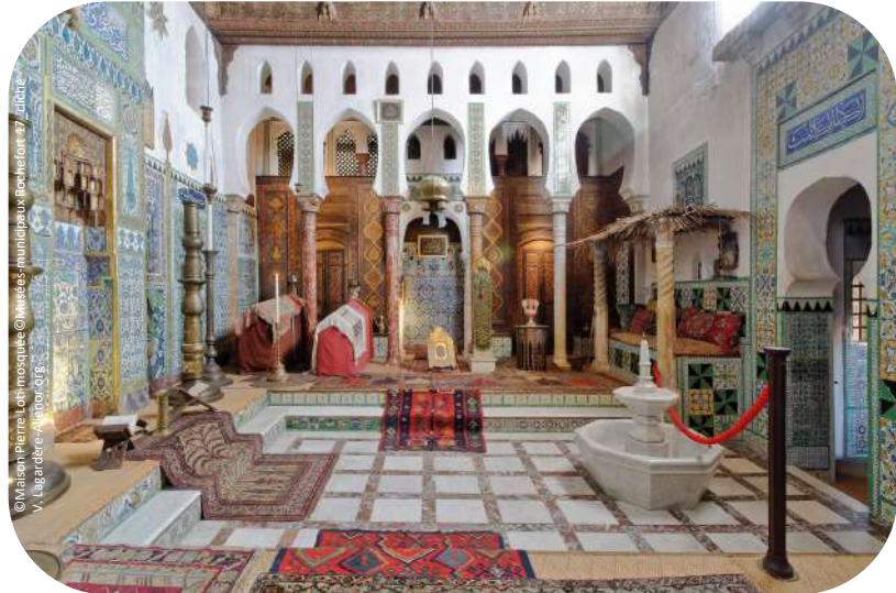
© Valérie Pierre Loti - Mosquée © Mairie de Rochefort - V. Lagarde - Alnoroff