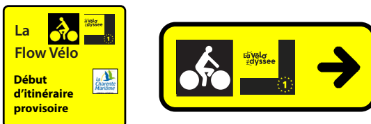
Autres exemples de signalisation d'itinéraire temporaire