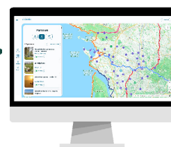
SITE INTERNET LOOPI