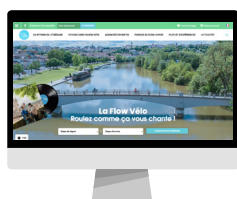
SITE INTERNET DES ITINÉRAIRES NATIONAUX (prestataire visible sur la carte de l'itinéraire et dans une fiche spécifique)

à forte audience puisent leurs informations depuis APIDAE (site d'information touristique) et vous permettent donc d'être valorisé :