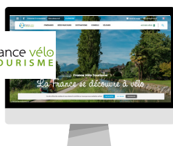
SITE INTERNET FRANCE VÉLO TOURISME