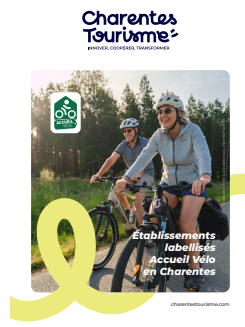
GUIDE DES LABELLISÉS ACCUEIL VÉLO DES CHARENTES