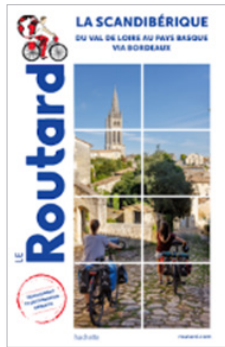
TOPOGUIDE DES ITINÉRAIRES *